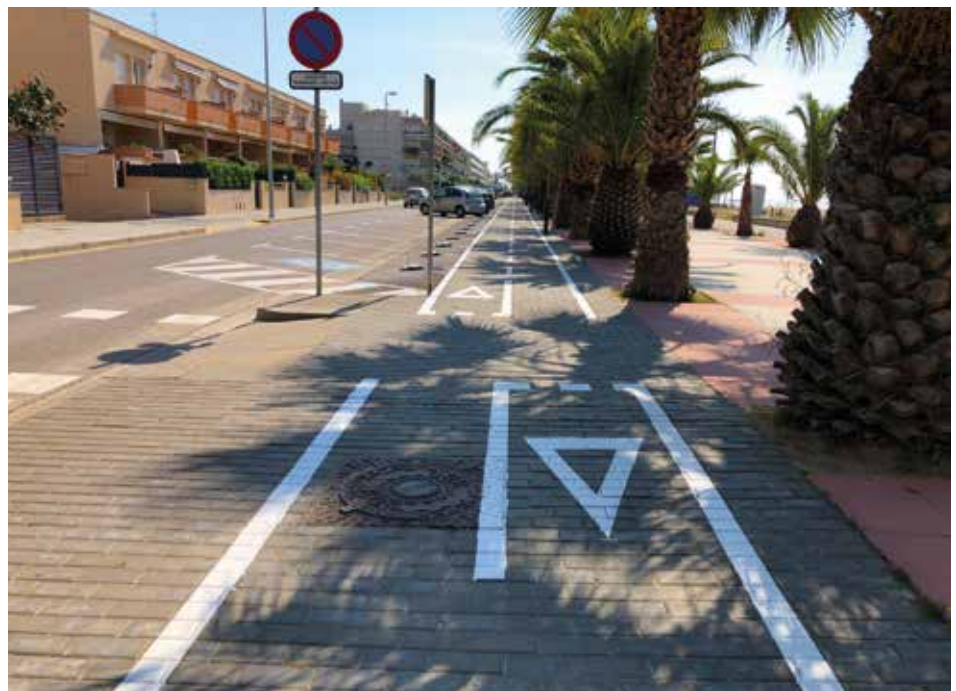
L'any passat es va aprovar la creació d'un carril bici, que ja és una realitat.

A banda de la votació online, a través del web municipal, enguany es preveu descentralitzar les votacions presencials. Així, s'estan estudiant els condicionants tècnics per tal de poder desplaçar el centre de votació en espais de gran aflluència de ciutadania, com els centres escolars, juvenils o esportius de la vila.