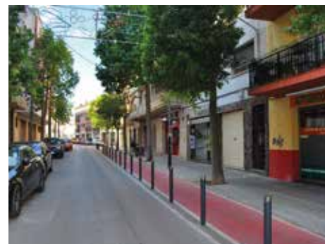
L'estiu suposa entre un 50% i un 70% de la facturació anual dels comerços locals.

ho, Talavera considera que cal "organitzar actes que dinamitzin Cubelles i la gent no hagi de marxar els caps de setmana per manca d'oferta local" .