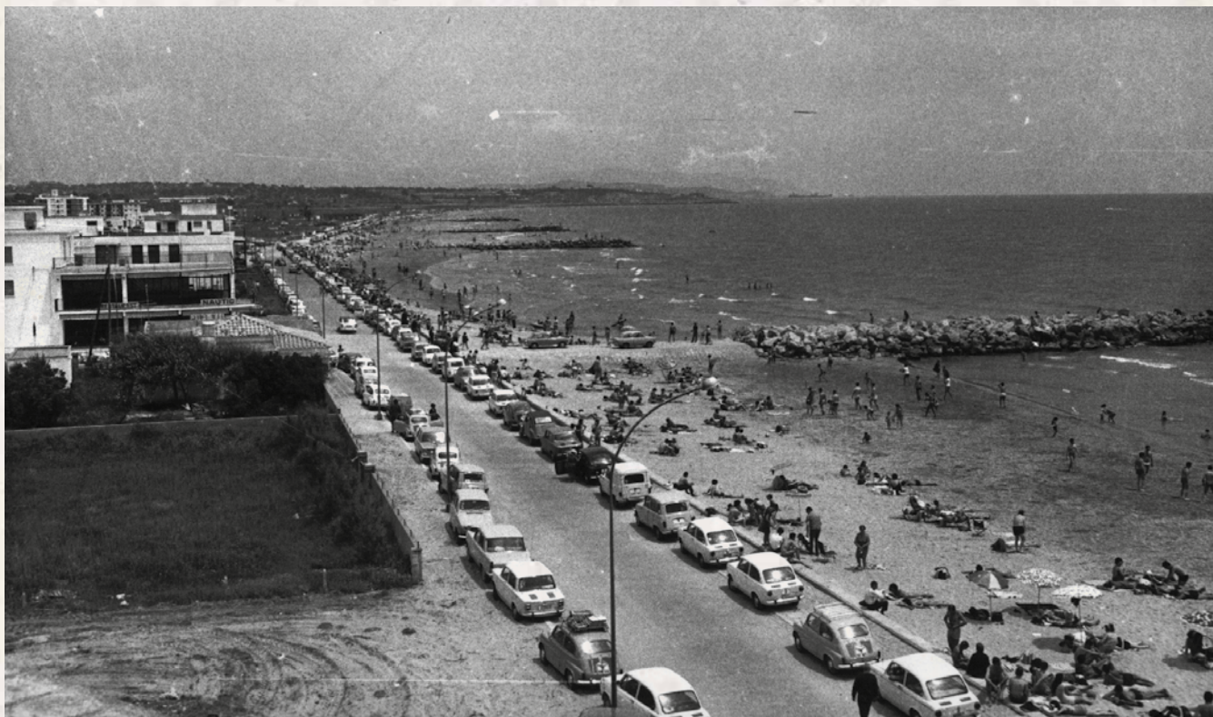
Racó d'en Pineda: Platges, dècada de 1960 (Arxiu Antoni Pineda).

Malgrat que històricament sempre s'ha dit que Cubelles havia viscut d'esquena al mar, ja a començaments del segle XX van començar a aparèixer els primers banyistes a les platges de la vila, bàsicament estiuejants procedents de Barcelona. El gran auge es va produir, sobretot, a partir de mitjans de la dècada dels 60, quan es podia aparcar a primera línia de mar i encara no existia el passeig Marítim. El boom turístic faria créixer el que ara és un dels grans atractius de la vila.