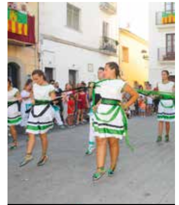
Els balls populars seran peça clau durant les festes majors.

I tot a punt per a la Festa Major Encara acomiadant la Festa Major petita començaran els primers actes de Festa Major, amb l'epicentre entre els dies 4 i 16 d'agost. El plegó, les cercaviles, el castell de focs i tots els actes folklòrics i tradicionals s'esdevindran pels carrers i places de Cubelles juntament amb el Motocròs, el Cubelles Rock City, cinema a la fresca, festa holly, nit de jazz, sardanes i els festivals de música electrònica i de novel·la negra Cubelles Noir. La principal novetat d'enguany serà la carpa del circ Raluy que s'uneix a un programa que inundarà Cubelles d'actes per a tots els gustos i totes les edats en el marc del dia gran de la vila dedicat a la patrona, Santa Maria.