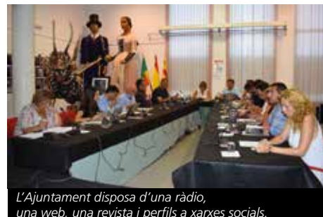
L'Ajuntament disposa d'una ràdio, una web, una revista i perfils a xarxes socials.

La sessió plenària també va aprovar la concertació d'un crèdit de 2.713.101,28 euros finançat de manera gairebé íntegra (2.602.628,14 euros) mitjançant el Programa de Crèdit Local de la Diputació de Barcelona que, mercès a la bona salut econòmica de l'Ajuntament, assumeix els interessos derivats permetent així que el consistori només hagi de retornar capital i els interessos