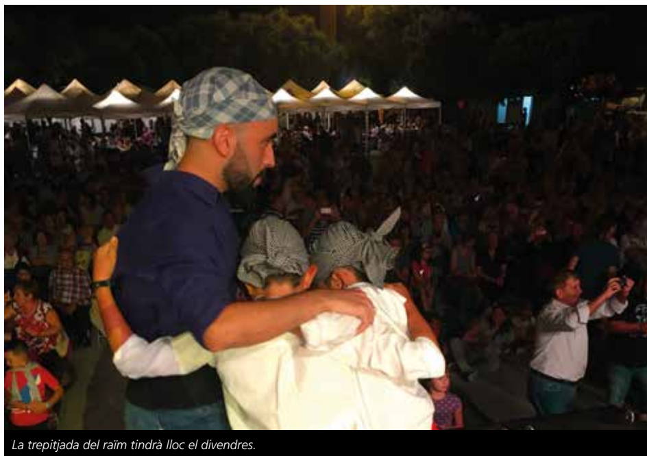
La trepitjada del raïm tindrà lloc el divendres.