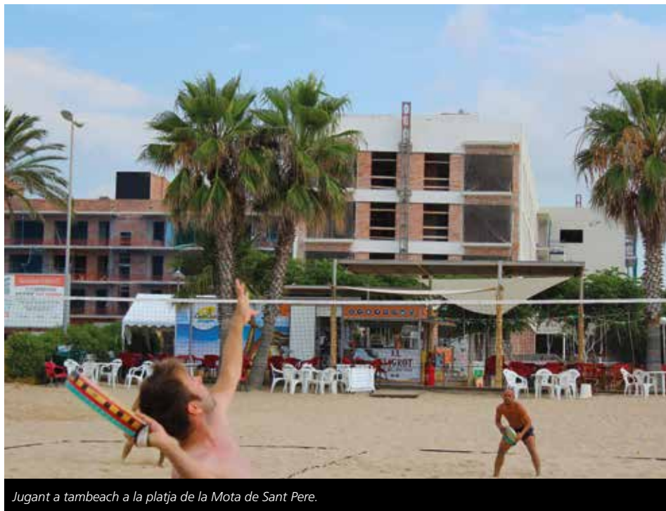
Jugant a tambeach a la platja de la Mota de Sant Pere.

Però en molts casos els esports no es valoren per la seva dificultat ni per la seva bellesa, sinó per l'espectacle que ofereixen al públic. Aquesta repercussió mediàtica i, de retruc, empresarial, ha afectat molts altres esports que no disposen de les ajudes econòmiques necessàries, ni del suport suficient per tirar endavant els seus esportistes. “El tambeach és un esport minoritari que