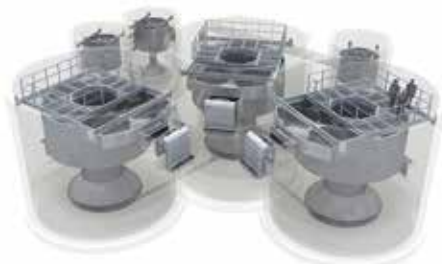
Esquema d'una instal·lació Vòrtex de l'empresa Hydro International.

parlar amb molts agents: municipis, l'ACA, Diputació de Barcelona, conselleries...", explica l'Alcaldessa. Totes les organitzacions i organismes han mostrat la seva predisposició a solucionar la problemàtica, "però el cert és que només hem aconseguit el suport econòmic de la Diputació, amb un 25%, que afegir al de l'ACA".