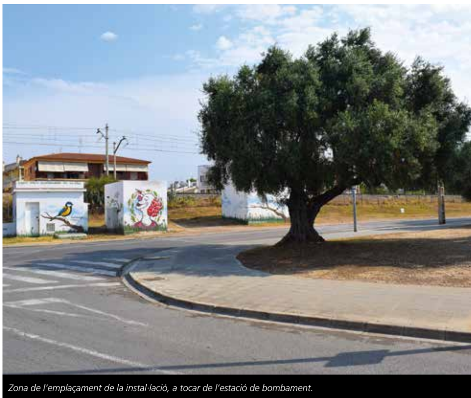
Zona de l'emplaçament de la instal·lació, a tocar de l'estació de bombament.

El Consistori aposta per la millor solució mediambiental per davant de la solució més econòmica