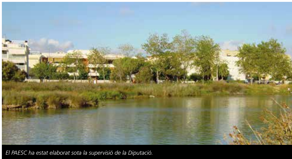
El PAESC ha estat elaborat sota la supervisió de la Diputació.