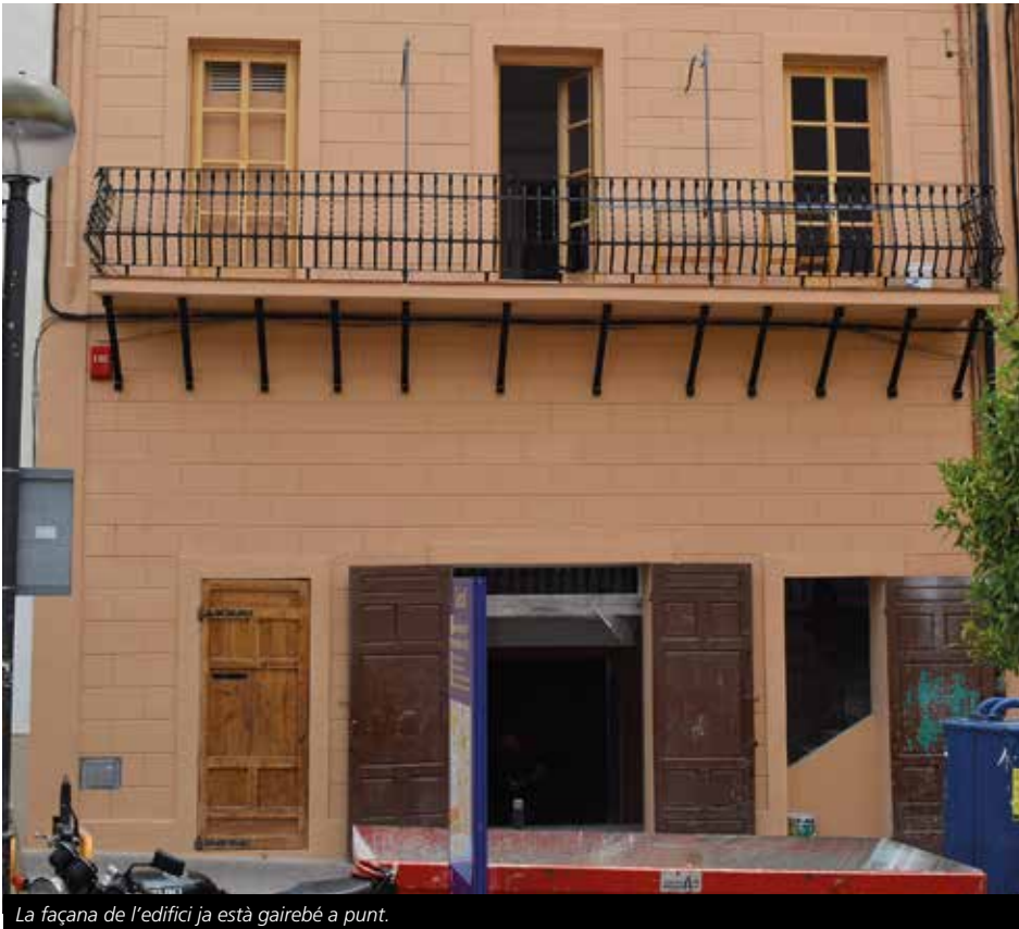
La façana de l'edifici ja està gairebé a punt.

L'acord tindrà una vigència de 18 anys amb possibilitat de dues pròrrogues de cinc anys