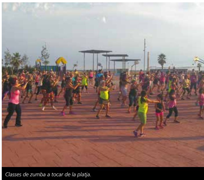
Classes de zumba a tocar de la platja.

ba a les diferents platges de Cubelles (consultar horaris al web municipal). Al centre urbà les visites guiades al Castell de Cubelles s'amplien a tots els caps de setmana de juliol i agost i es mantenen les visites guiades a la desembocadura del riu Foix el darrer diumenge de mes. Tota la informació dels actes municipals està disponible al web www.cubelles.cat i es pot rebre setmanalment a la bústia de correu-e subscriuint-se al butlletí municipal d'informació.