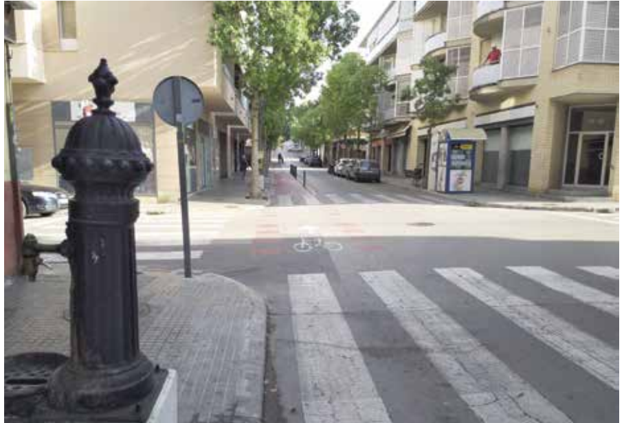
El passeig de Vilanova és un dels eixos principals del municipi.

La campanya participativa es complementarà amb tres tallers sectorials, dues convocatòries obertes al públic en general i una exposició dels resultats i conclusions del procés. A més, una comissió de seguiment formada per tècnics municipals, l'empresa dinamitzadora i un grup de persones