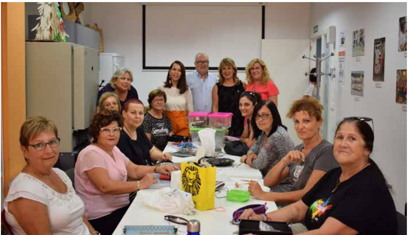
El grup candler de Cubelles és un dels més actius de l'associació.

Uns minuts de formació, moltes hores de pràctica i... a fer polseres. Les voluntàries es mostren satisfetes i realitzades per la seva tasca solidària que serveix per seguir investigant el càncer infantil. ●