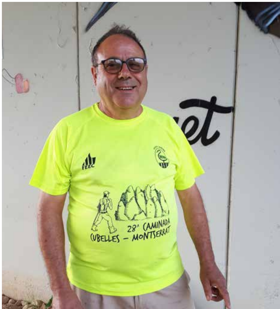
Fauna Cubelles ja té encarat el seu calendari d'activitats fins a finals d'any.

Hi van col·laborar la Generalitat, que va regalar 600 samarretes, i la mateixa abadia. Recordo que van pujar-hi unes 600 persones, amb els Balls Populars, el Cor l'Espiga... És una feina que costa molt, per això cal un reconeixement als seus impulsors.