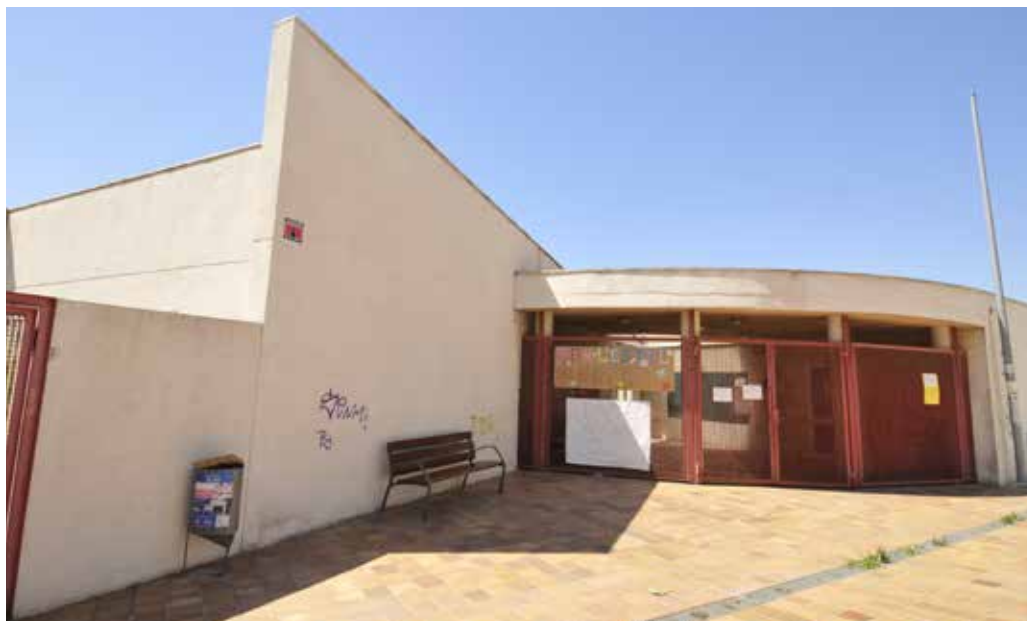
El nou servei s'ubicarà en un equipament actualment en desús que també acollirà l'Espai Jove.

durada possible i ha de ser regularment revisada, en alguns casos trimestralment. La finalització del suport de l'aula integral ha de ser