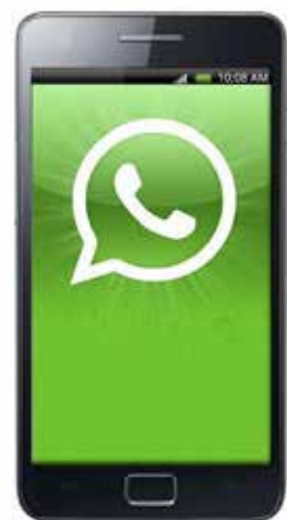
Els avis rebran la informació al mòbil.

o altra informació que tinguin en la gent gran el seu públic potencial. No serà un canal de comunicació amb l'Ajuntament, doncs no es respondran missatges dels usuaris. Tan sols es faran arribar aquelles comunicacions que tradicionalment el conjunt de la gent gran havia fet constar a la regidoria que no hi tenien accés, ja que no són un col·lectiu gaire avessat a la consulta periòdica de pàgines web ni usuaris actius de xarxes socials, però sí, en canvi, tenen domini d'ús de Whatsapp. Per subscriure's a aquest servei cal adreçar-se al Casal d'avis o al web municipal www.cubelles.cat . ●