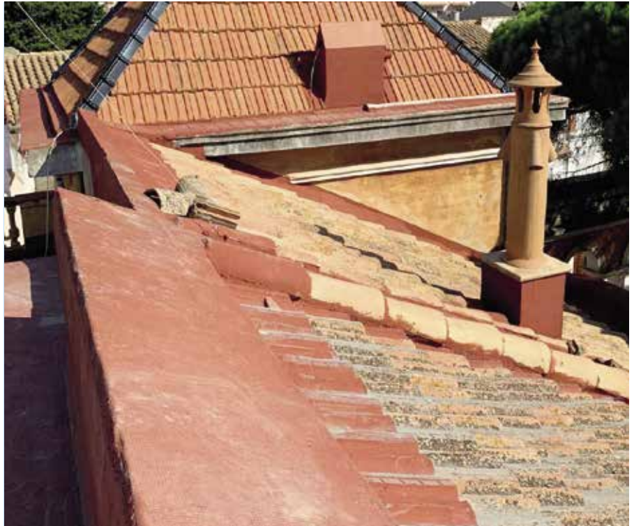
L'aïllament evitarà filtracions d'aigua com les que han malmès l'equipament.

va fer una anàlisi de les patologies de la finca, alhora que es va constituir la comissió d'estudi del patrimoni local, el gener de 2018. ●