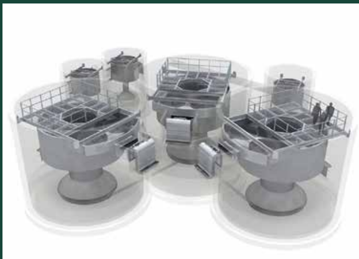
Recreació virtual 3D del sistema Vortex que s'instal·larà al subsòl.

cercant vies de finançament per sufragar amb fons supramunicipals el cost de l'obra. Així, la Diputació de Barcelona es compromet a aportar el 25% de l'ampliació de l'estació de bombament. El 50% restant, uns 750.000