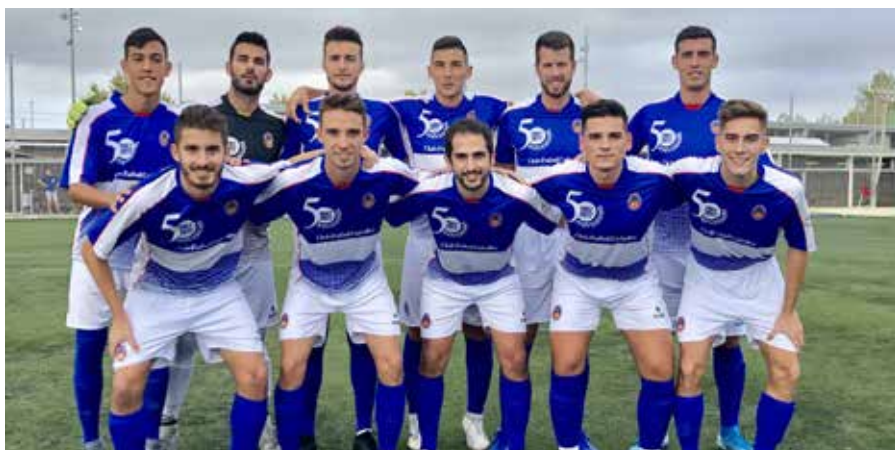
Alineació del primer equip del Club de Futbol Cubelles per a la temporada 19/20.