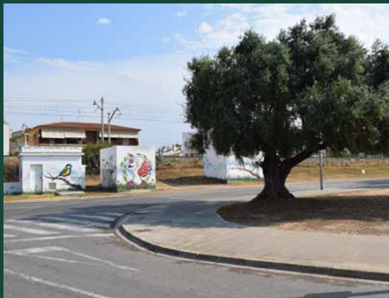
Emplaçament de la nova estació de bombament al pg Fluvial.

També s'ha fet un abalisament de la platja situada a l'Espai Natural de la Desembocadura del riu Foix, espai que forma part de la Xarxa Natura 2000 i de l'Inventari de Zones Humides de Catalunya i que s'està utilitzant com a àrea de descans d'entre d'altres espècies, de la gavina corsa, la gavina capnegra i xatrac, el bernat pescaire, camallarga, martinet blanc, polit cantaire, blauet i corriol camanegre.