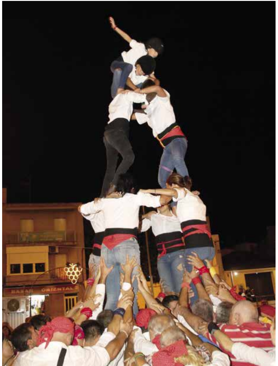
A l'esquerra, coronació de la torre de cinc i, a la dreta, el quatre de cinc. A baix, imatge de grup amb els grallers de l'Agrupació.

no s'havien enfaixat mai. El bon moment de la colla es va confirmar durant la celebració de la Fira del Cupermut, on van calcar actuació amb l'afegit que, en aquesta segona ocasió, els Castellers del Foix presentaven algunes baixes significatives, en especial al pom de dalt.