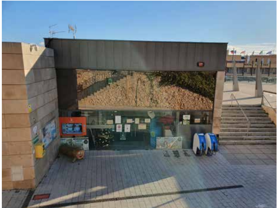
Les instal·lacions compartirien edifici amb l'OPIC, al bell mig de la vila.

L'equipament s'ubicarà a la planta baixa de l'actual Centre Social Joan Roig i Piera