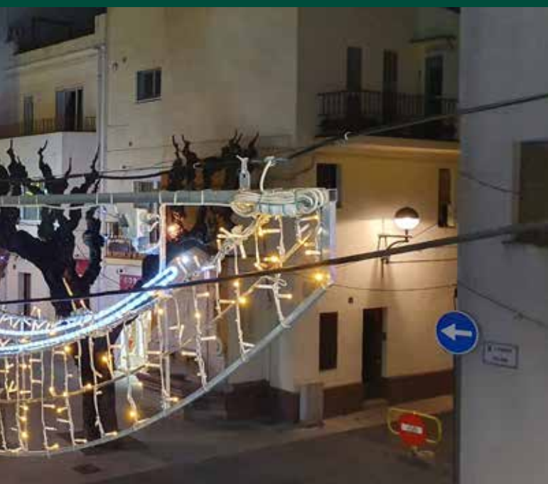
gran de la vila per la seva actitud durant la pandèmia sanitària.

Més enllà de les accions específiques de Nadal, des de l'Ajuntament també s'està ultimant l'elaboració d'un documental amb finalitats pedagògiques i sensibilitzadores que posi en valor els interessos i inquietuds de la gent gran del municipi, tot trencant falsos mites i tòpics i advocant per la seva capacitat d'inclusió. ●