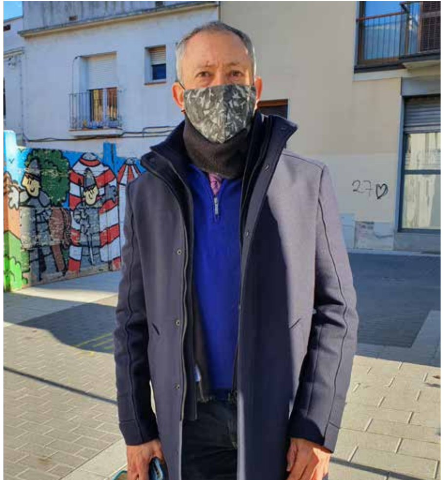
L'actuació de Cs està molt marcada pels àmbits mediambientals i urbanístics.

cal requalificar una pastilla agrícola, existeixen altres opcions properes. Curiosament, a més, un cop adquirit el solar com a agrícola, després ha crescut en 700m 2 , de manera que ara podrà augmentar la seva edificabilitat. I no oblidem també que l'ACA desaconsella construir instituts en zones inundables. Això ja va passar a la zona de la comissaria de la policia i ja sabem què passa quan plou amb una mica de força. Jo això ja ho vaig denunciar en el seu dia com a professional, però em van recusar perquè vivia en aquella zona.