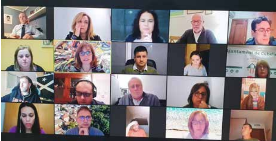
La sessió corresponent al mes de novembre es va celebrar de manera telemàtica.

El ple tira endavant l'alineació de la vorera del carrer de Sant Antoni i el calendari fiscal 2021