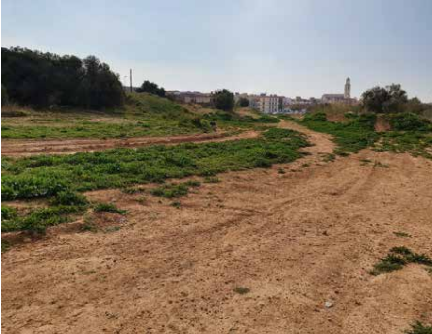
La parcel·la està ubicada a tocar de l'escola Charlie Rivel i la plaça del Mercat.

Passat el període d'al·legacions, es donarà la parcel·la a la Generalitat per a la seva edificació