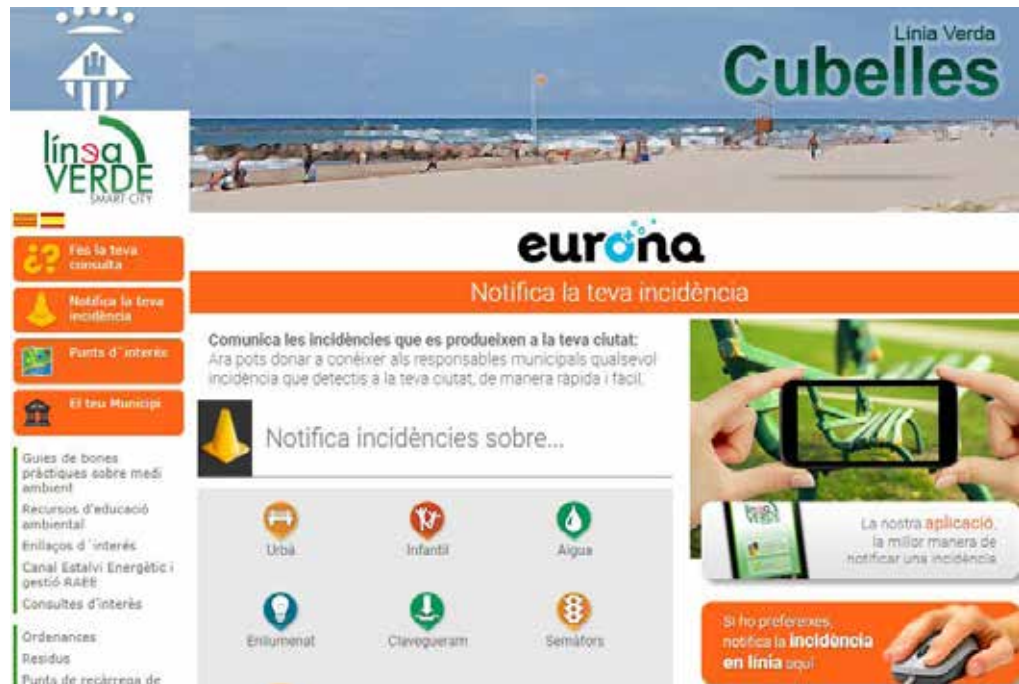
La web del servei permet formular incidències i rebre informació mediambiental.

aplicació mòbil (disponible gratuïtament a Google Play i App Store) i una pàgina web que es donarà a conèixer a principis del proper gener. Inicialment es posarà a disposició de la ciutadania la possibilitat de crear incidències de mobiliari urbà i infantil, d'aigua, enllumenat, clavegueram, semàfors i la retirada de mobles (que segueix funcionant a través del telèfon 683 385 542).