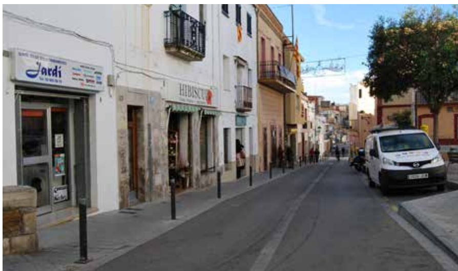
La nova línia agilita els tràmits i la concessió definitiva.

S'hi abocaran 30.000 euros per pal·liar els efectes econòmics de la pandèmia