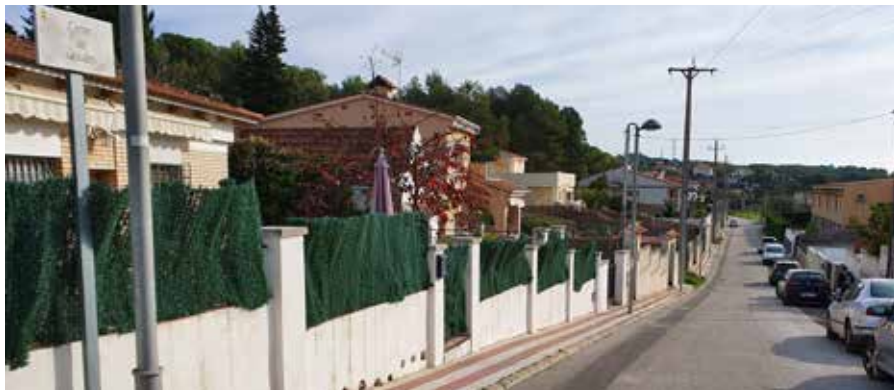
L'aportació total és de 126.521 euros.

Un cop es redacti la memòria tècnica i el posterior projecte, es podrà