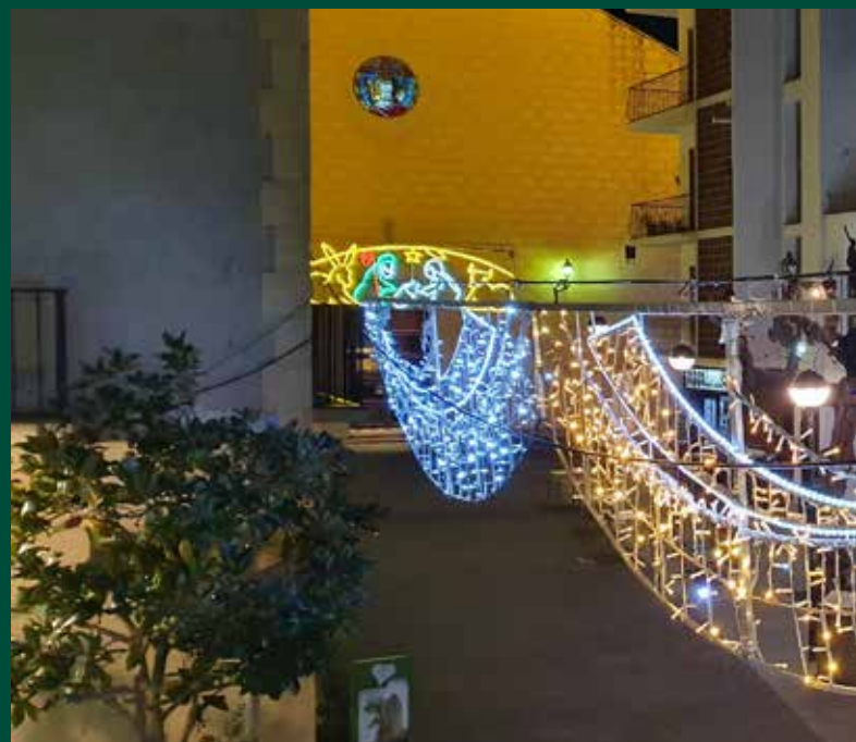
S'han repartit plantes a 2.500 llars del municipi com a agraïment a la gent

del projecte, ahora que permetrà estrènyer el seu seguiment i potenciar el suport emocional que se'ls proporciona des de la regidoria de la Gent gran. De moment, la prova pilot es posarà en marxa amb vuit persones grans de les 200 monitoritzades des de l'Ajuntament de la vila en risc de situació de solitud.