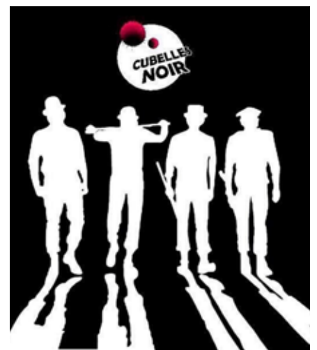
La propera edició serà l'agost vinent.