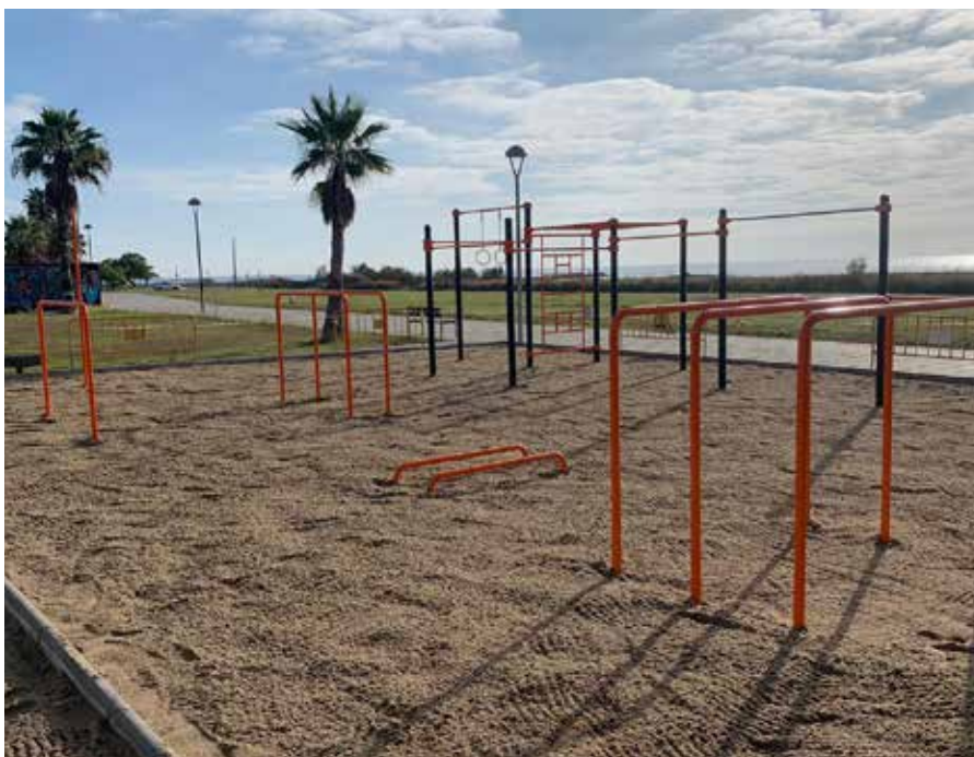
El circuit de cal·listènia de Cubelles.

Les autoritats sanitàries limiten l'aforament dels espais esportius a l'aire lliure i obliguen al tancament d'aquells que no disposin de cap sistema de control d'aforament. Tal com succeeix amb l' skateparc , la pista esportiva del parc de Santa Maria o altres zones esportives de lliure accés, romandrà tancat fins que les condicions sanitàries ho aconsellin. ●