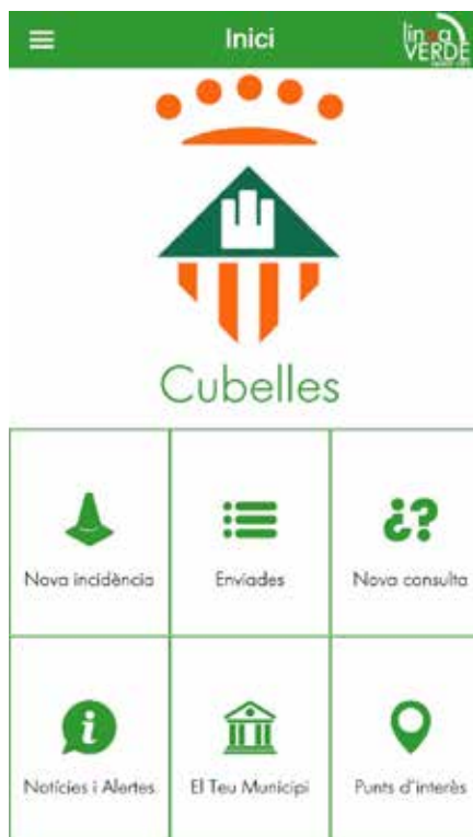
L'app mòbil Línia Verda.

L'eina Línia Verda s'ha estat desplegant a nivell intern al llarg de tot aquest any, i que entrarà en funcionament al gener. Funciona amb un