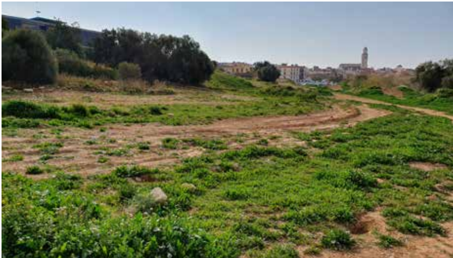
La parcel·la està ubicada a tocar del centre mèdic i l'escola pública Charlie Rivel.