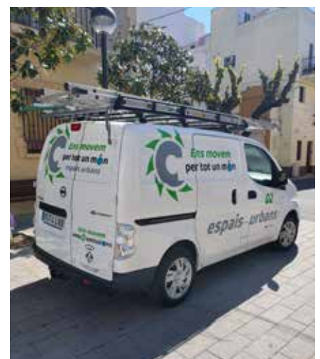
L'acció reduirà les emissions de CO 2 .

L'electrificació del parc mòbil municipal ja s'havia estès a la Policia Local que, des de fa anys, disposa de vehicles elèctrics (motocicletes) i híbrids per a les seves rutes. Igualment, també s'havia inclòs a la licitació del nou servei de neteja viària la incorporació de vehicles que redueixen les emissions. Amb tot, al mercat de vehicles electrificats encara s'han d'incorporar els camions, grues i vehicles de servei, actualment encara lluny de l'electrificació per una qüestió d'eficiència. ●