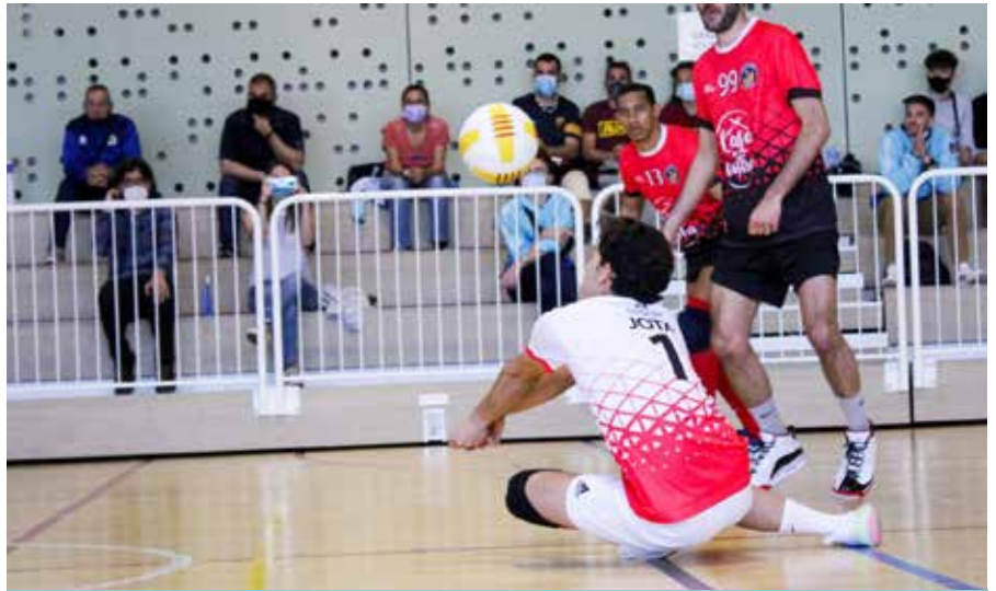
La plantilla del Club de Vòlei Cubelles està completant una atípica bona temporada.

Pel que fa a l'hoquei, el Club Patí Cubelles ja ha pogut tornar a la com-