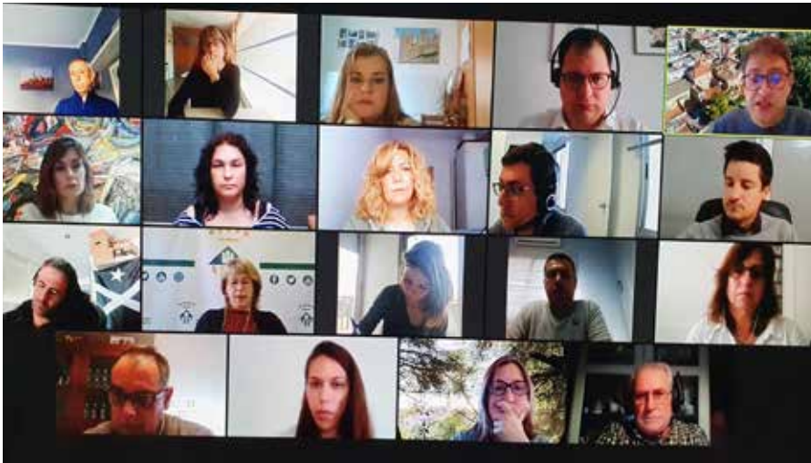
La sessió va tenir lloc de forma telemàtica el dijous 29 d'abril, a les 9.30 h. del matí.

Els comptes inclouen 335.000 euros en ajudes socials i una previsió d'inversions de 7 milions