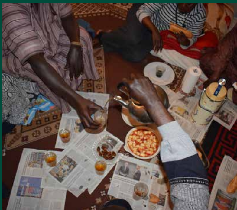
Dues de les principals comunitats islàmiques existents al municipi són d'

Un dels moments més celebrats durant el ramadà és l' iftar , l'instant en què els cubellencs musulmans trenquen el dejú, preferentment en comunitat. "És un mo-