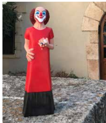
Nino de goma dedicat a Charlie Rivel.

Així mateix, també s'han posat a la venda una sèrie de didals de ceràmica dedicats a diversos motius de Cubelles que anualment s'entregaven a les participants en les trobades de Puntaires i que es posen a la venda al preu de 3,50 euros. Aquests nous elements s'uneixen als ja comercialitzats com son els llibres d'edició local i objectes dedicats a Charlie Rivel: el nas, el penjoll, el pin de plata i les samarretes. ●