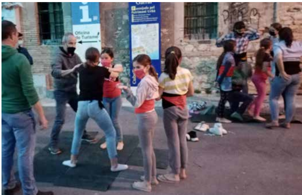
La convocatòria dels primers membres a reprendre l'activitat ha estat un èxit.

tivitat son baixos, cordons, agulles i crosses i, a mesura que la situació ho permeti, s'aniran reincorporant la resta de membres de la colla. ●