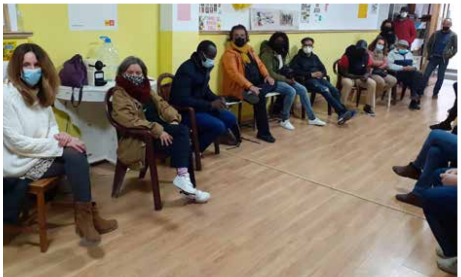
Primera assemblea del col·lectiu Cubelles Acull

Per contactar amb la plataforma podeu enviar un correu electrònic a coopcubelles@gmail.com . ●