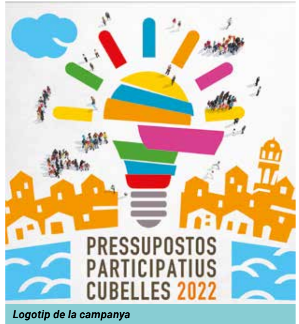
Logotip de la campanya

Les idees que passin aquest tall aniran a la fase de votació, prevista inicialment per a finals del mes de juny. Al llarg d'una setmana, els cubellencs i cubellenques empadronats majors de 16 anys podran consultar les diferents candidatures i n'hauran de votar tres. Finalment, la comissió de seguiment les ordenarà de més a menys votada, esgotant la partida pressupostària.