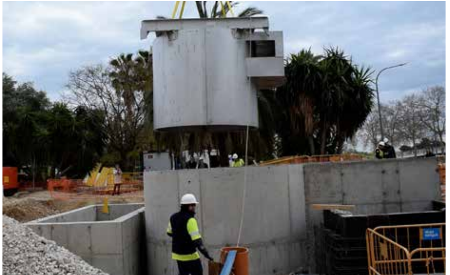
Treballs d'instal·lació del sistema Vòrtex, que compleix sis mesos de funcionament.

Cal ampliar la capacitat de l'estació de bombament per millorar-ne l'eficiència