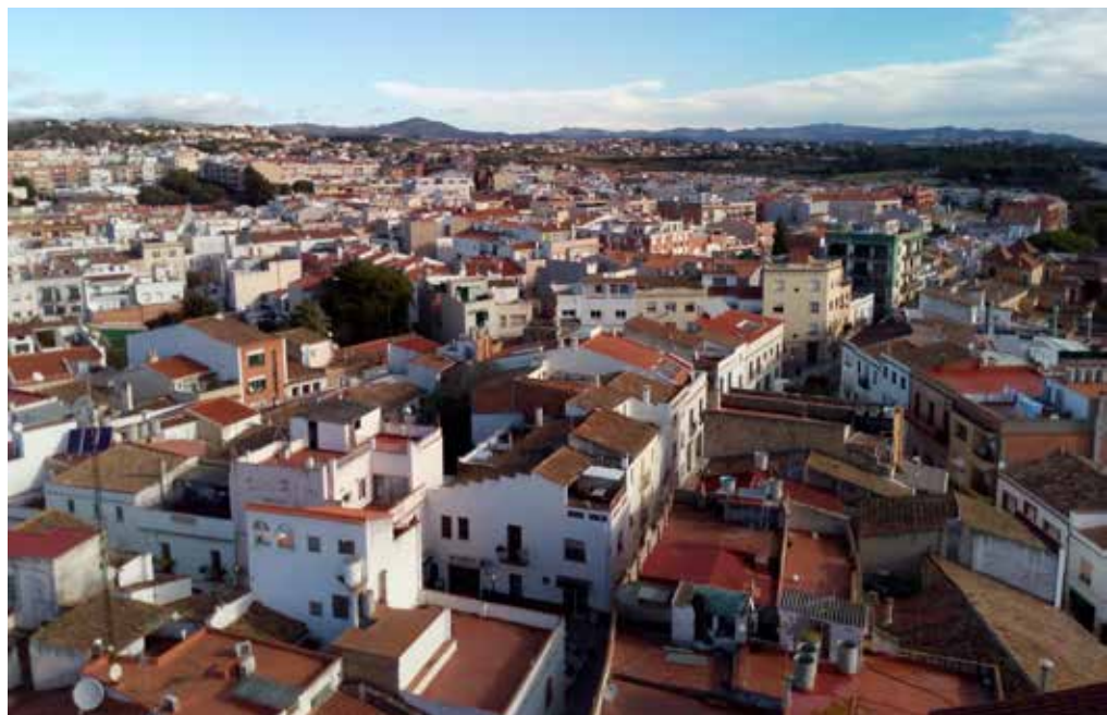
L'Ajuntament s'encarregarà de captar habitatges per incorporar-los a la iniciativa.

21 milions d'euros amb l'objectiu d'arribar a llogar entre 1.300 i 1.500 habitatges nous durant el present exercici. ●