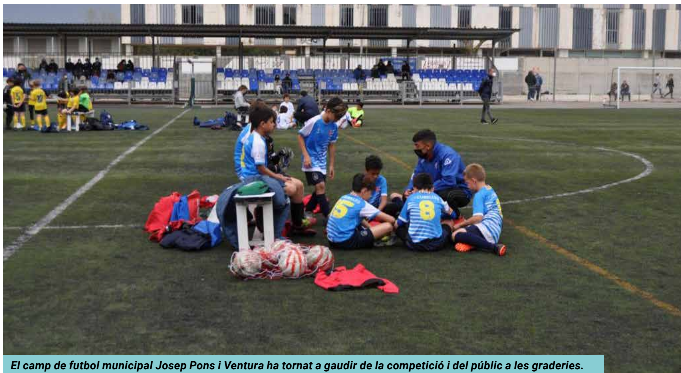
El camp de futbol municipal Josep Pons i Ventura ha tornat a gaudir de la competició i del públic a les graderies.

Les blaves es troben just a l'equador de la competició i esperen seguir millorant en aquesta segona part del campionat. ●