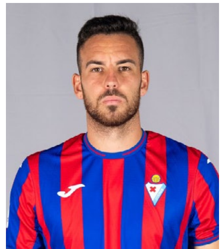
El centrecampista de Mas Trader.

El migcampista va passar pel futbol base del Cubelles abans de saltar a la DAMM i el filial del Dèpor. ●