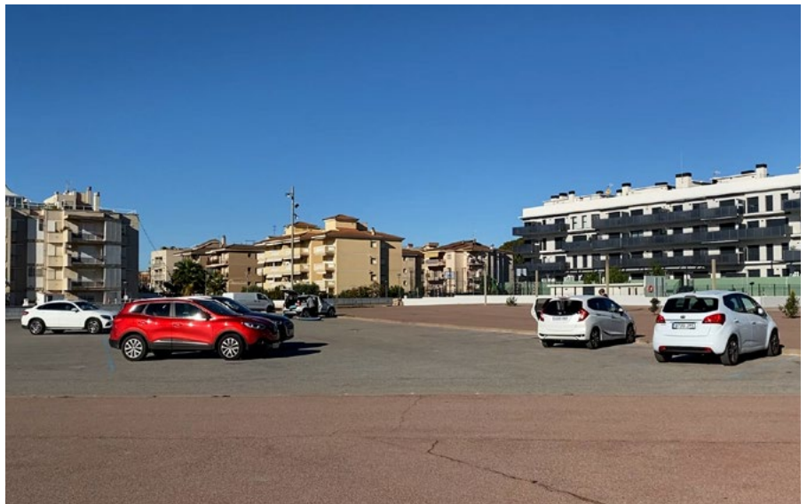
El cost total de l'abonament no arribarà a 1 euro a la setmana.

D'altra banda, l'Ajuntament de Cubelles també ha previst que la franja horària de les 14.00 h. a les 16.00 h.