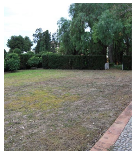
La iniciativa s'ubicarà a Can Travé.

El projecte, del qual es coneixeran en breu els detalls per prendre-hi part, disposa de l'acompanyament de Tarpuna, una de les cooperatives amb més recorregut en aquesta mena d'empreses arreu de la demarcació, amb experiències a municipis com Sant Feliu del Llobregat, Cornellà i Barcelona. ●