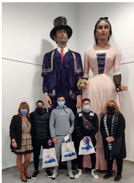
L'Ajuntament va agrair als joves la feina feta.

El documental Joves migrants sols. Camí a l'emancipació ha estat realitzat per Arnau Guardia i es pot veure al canal de Youtube de l'Ajuntament de Cubelles en català subtítulat a l'àrab, a càrrec de Rafia El Jerabi. ●