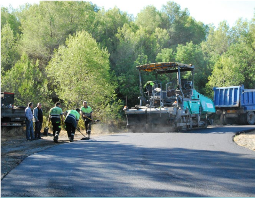
Bona part dels ingressos es destinaran a actuacions a la via pública i zones verdes.

El ple de novembre es manifesta de forma unànime contra totes les violències masclistes