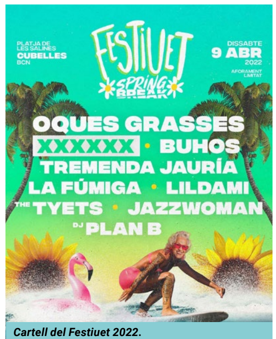
Cartell del Festiuet 2022.

Boom Boom Produccions és una empresa de representació d'artistes que organitzen altres festivals, com PintorRock (El Morell) i Bonus track (Poble Espanyol), a banda de gestionar la sala Redstar, a Valls, la capital de l'Alt Camp. ●