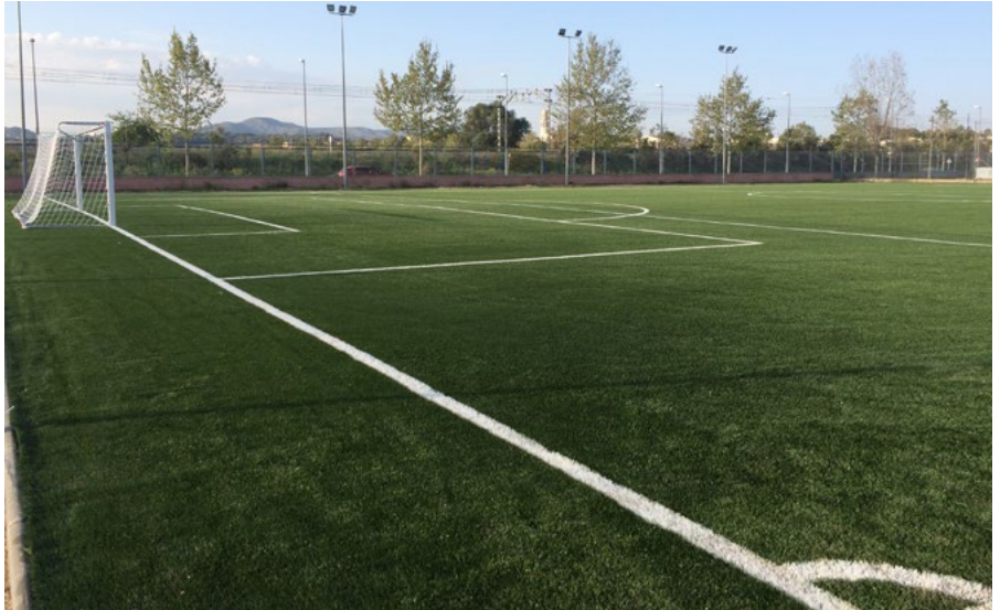
Les noves instal·lacions del camp de futbol 7 es van inaugurar el maig de 2018.

neoprè de suport a l'estructura per tal de reforçar la seva fixació.