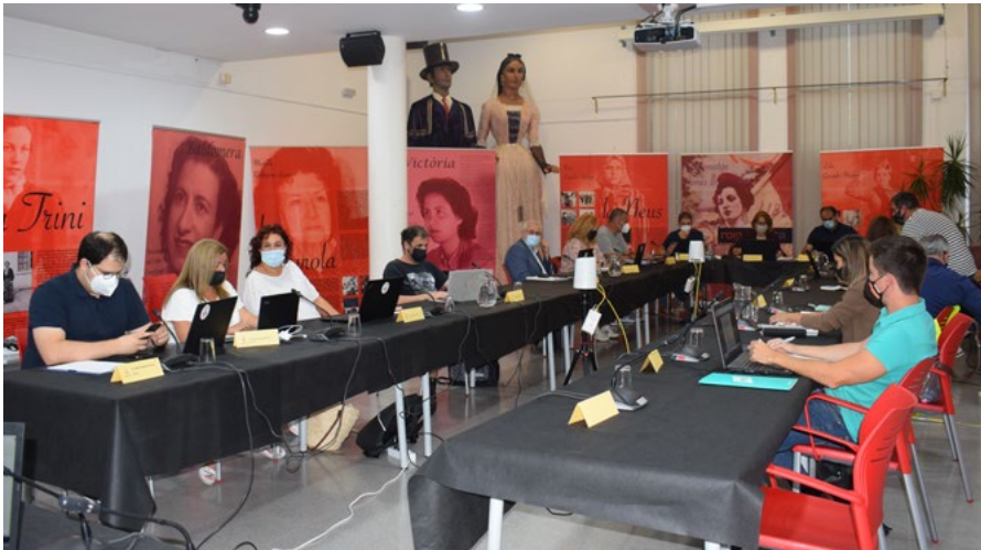
Els grups també van tirar endavant una declaració contra les violències anti LGTBI.

La sessió ordinària del mes de setembre recupera la presencialitat vint mesos després