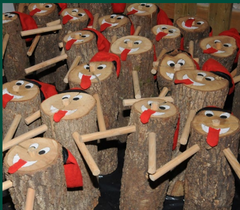
Els nadons nascuts durant l'any 2021 podran recollir el seu tió de Nadal.

També durant la celebració està previst un taller de cuina amb energia solar, dins de la voluntat de la Fira de promoure accions de conscienciació mediambiental.