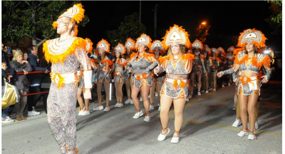
L'edició 2020 va ser l'última que es va poder celebrar sense restriccions.

forcin el contingut dels estereotips de gènere, cosifiquin i sexualitzin els cos de les dones i les nenes o siguin ofensius contra la dignitat de les dones, nenes i col·lectiu LGTBI+. En cap cas es permetran actes que constitueixin violència sexual ni de cap tipus cap a les dones i el col·lectiu LGTBI+.