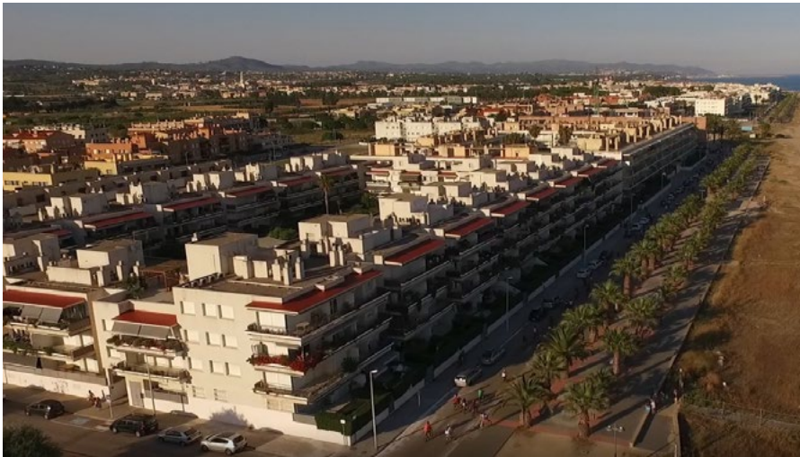
Els grups també van tirar endavant un seguit de bonificacions a l'IBI.

La sessió extraordinària d'ordenances fiscals rebaixa el tram de connexió a la xarxa de l'aigua