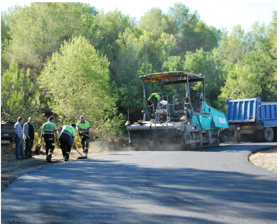
Els treballs estan previstos que s'executin a partir de començaments de 2022.

La durada màxima de les obres per a cada una de les fases serà de tres mesos i es treballa perquè puguin iniciar-se a començaments de 2022.