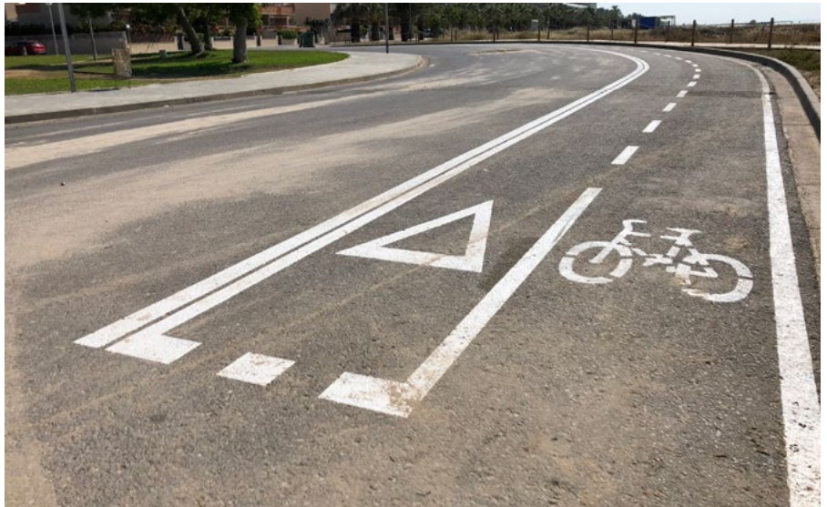
El carril bici escolar serà una de les actuacions dels pressupostos participatius 2022.

d'aquest procés perquè el seu pressupost, sumat al de les opcions més votades que les precedeixen, superen l'import màxim.