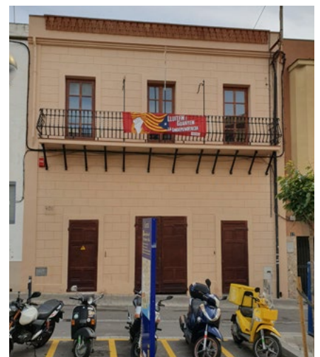
Façana del cafè-teatre, fundat el 1914.

Des de l'Ajuntament s'ha volgut destacar la bona entesa i col·laboració amb els actuals gestors de l'entitat, que van ser informats personalment de la decisió, a l'hora que ha expressat el seu convenciment que la recuperació d'aquest espai tan emblemàtic per al municipi esperonarà la vida associativa i cultural de la vila. ●