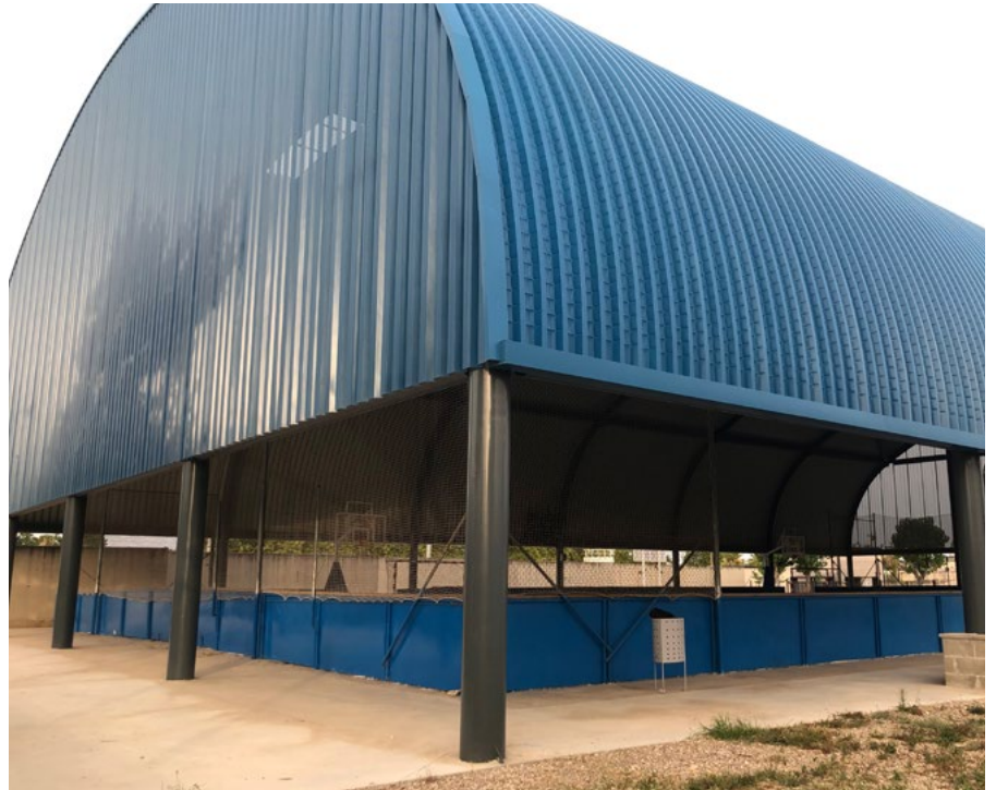
La festa de cap d'any tindrà lloc a la nova pista coberta del Poliesportiu.

Aquesta celebració s'havia portat a terme alguns anys enrere al mateix Poliesportiu. ●