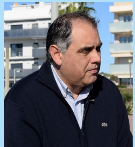
El titular d'Espai públic, J. M. Hugué.

El també màxim responsable de Medi ambient ha recordat que la implantació del servei s'està duent a terme conjuntament amb la resta d'actors implicats. ●