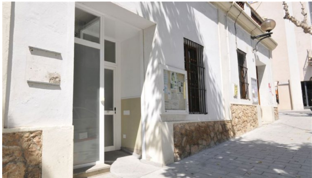
Prèviament, cal demanar hora a la regidoria de Benestar social.

atenent-se un màxim de vuit consultes presencials a la setmana. La iniciativa s'adreça a col·lectius en situació d'especial vulnerabilitat i mitjançant la validació de l'àrea de Benestar social de l'Ajuntament. ●