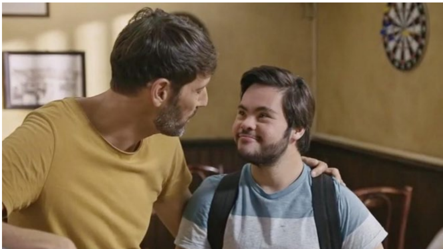
A la sèrie 'Plus belle la vie' interpreta el paper d'un cambrer molt especial.

Sí, molta gent! Qualsevol que em vulgui seguir ho pot fer a Instagram, Facebook i Snapchat. Serà un plaer, estic molt content i agraït de tota la gent que em segueix. ●