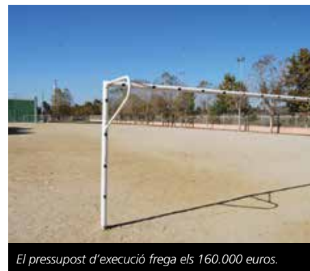
El pressupost d'execució frega els 160.000 euros.

Un cop aprovat el projecte, s'obrirà un concurs públic entre les empreses que decideixin concorre-hi i, tot seguit, s'adjudicaran les obres, que ja podrien començar a executar-se a finals del 2017 o bé a començaments de l'any vinent. La instal·lació de gespa artificial, juntament amb la resta de millores projectades, respon a una demanda recurrent del Club de Futbol Cubelles i altres col·lectius de la vila que reclamen l'adequació del camp de futbol per poder ampliar la seva oferta formativa i permetre la pràctica d'aquesta disciplina esportiva en una superfície de més qualitat i comoditat.