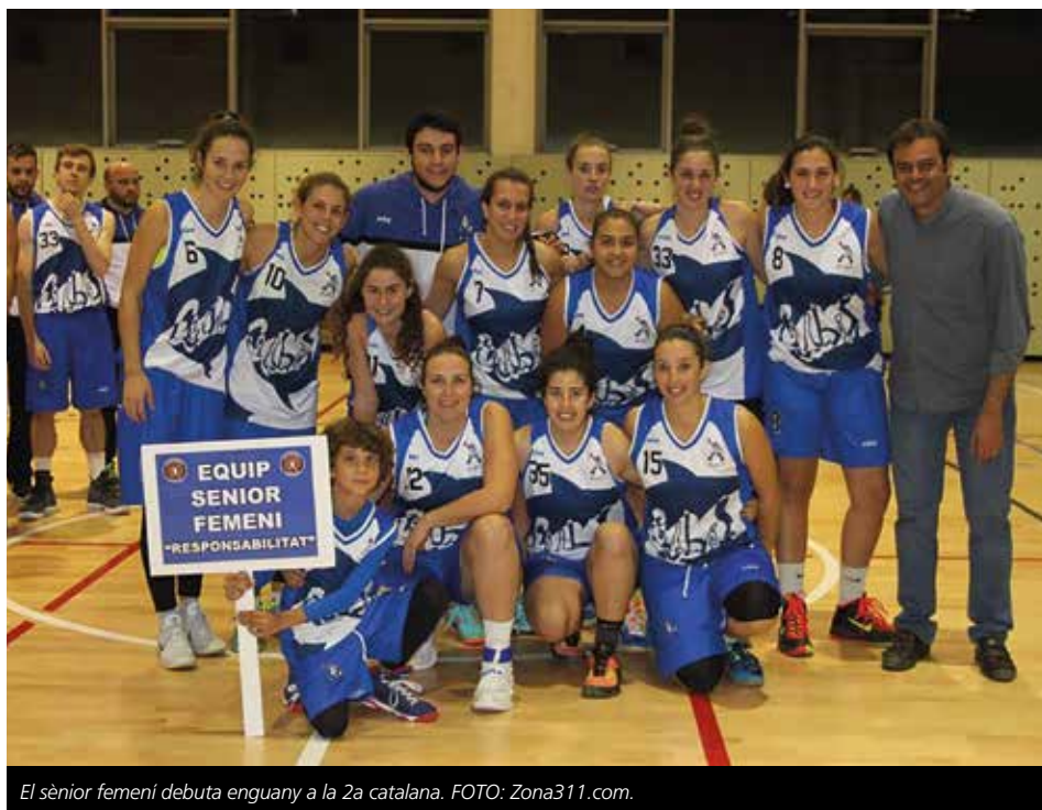
El sènior femení debuta enguany a la 2a catalana.