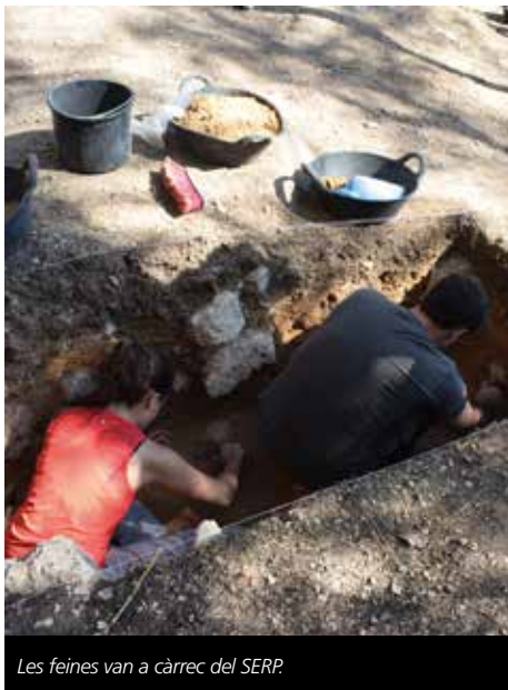
Les feines van a càrrec del SERP.

Concretament, es tracta d'una punta mosteriana similar a la que ja es va trobar l'any passat, tot i que en més bones condicions; fragments de peces de sílex, i res-