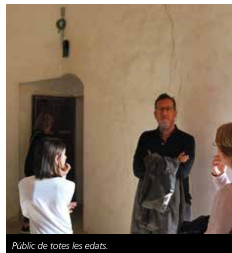
Públic de totes les edats.

www.cubelles.cat / www.turisme.cubelles.cat / visitescastell@cubelles.cat / info@arcultural.cat