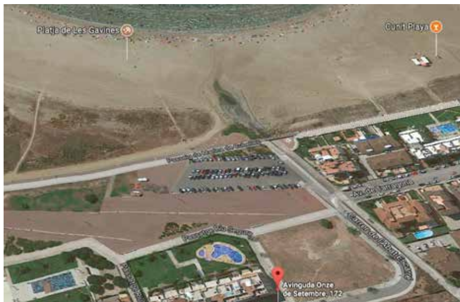
La parcel·la està ubicada a Les Salines, gairebé a tocar de Cunit.

Aquesta venda ha de finançar diverses partides d'inversió del pressupost municipal. Per aquest motiu, la seva alienació és important per poder afrontar projectes vinculats com la rehabilitació de Can Travé, certes millores a la via pública i l'enllumenat, equipament de festes municipal o millores al Poliesportiu municipal.