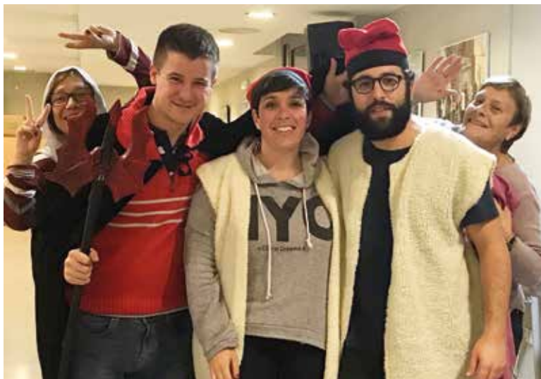
Els assajos han estat força intensos.