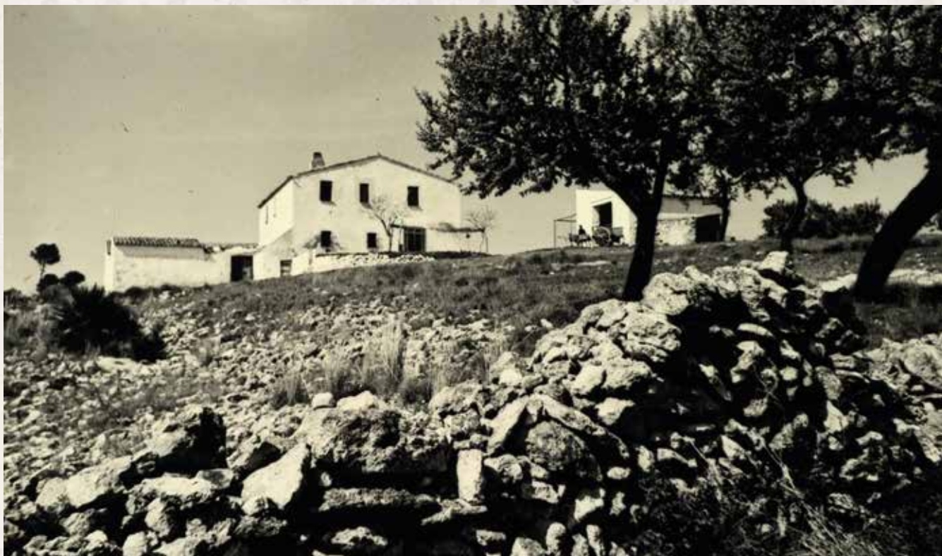
Corral d'en Cona, mitjan segle XX

Les masies de Cubelles han ocupat un paper cabdal en la vida social i econòmica de la vila. La seva evolució juntament amb la del seu entorn palesa els canvis urbanístics que ha experimentat el municipi al llarg dels segles i, en especial, les darreres dècades, on la transformació ha estat més significativa i accelerada. A la imatge, es pot comprovar l'estat de la masia de Corral d'en Cona a mitjan del segle passat, abans de la urbanització del barri.