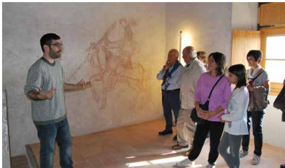
La guia va a càrrec dels professionals d'Arc Gestió Cultural.