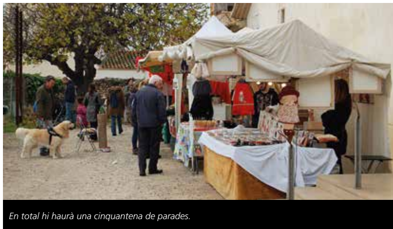
En total hi haurà una cinquantena de paradetes.

Una de les novetats de l'any passat, el lliurament dels tions als infants, es reedita amb els nascuts l'any 2017. És un acte de reconeixement de l'Ajuntament de Cubelles a les cubellenques i cubellencs que durant l'any 2017 han estat mares i pares. Es tracta d'un tió que s'obsequia a cada nadó per a fomentar les tradicions nadalencs arrelades a la nostra terra i com a reconeixement del municipi als més petits de la casa. Per a recollir el Tió Nadons 2017, s'ha d'omplir el formulari que s'annexa al web municipal www.cubelles.cat . Les persones que reuneixin els requisits de la campanya podran passar a recollir el Mini Tió Nadó durant tota la Fira de Nadal a la carpa de l'Ajuntament de Cubelles, prèvia acreditació del naixement del nadó (llibre de família i certificat d'empadronament si s'escau).