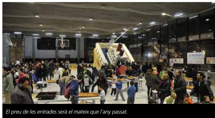
El preu de les entrades serà el mateix que l'any passat.

El preu de l'entrada també es manté en 3 euros per dia per als infants de 2 a 12 anys i de 2 euros/dia per a famílies nombroses. Al Parc de Nadal es podrà gaudir de les tradicionals activitats de ludoteca infantil, tallers, inflables, llits elàstics i alguna novetat respecte edicions anteriors que encara no s'ha desvelat.