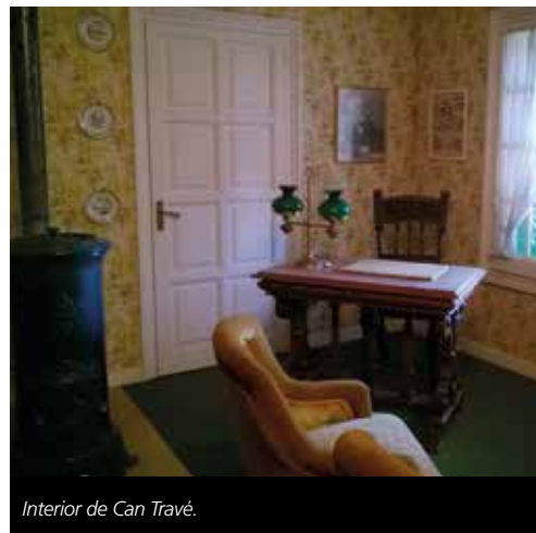
Interior de Can Travé.

Una de les funcions fonamentals dels ajuntaments és la protecció, la conservació, la investigació i la difusió dels coneixement del patrimoni històric i cultural material i immaterial, que constitueix el testimoni de la trajectòria d'un poble, de la seva història i de la seva identitat. Mitjançant la creació d'aquesta comissió, es desenvolupa l'article 10 del Catàleg i pla especial de protecció del patrimoni històric, arquitectònic i ambiental aprovat en ple el 31 de desembre de 2003.