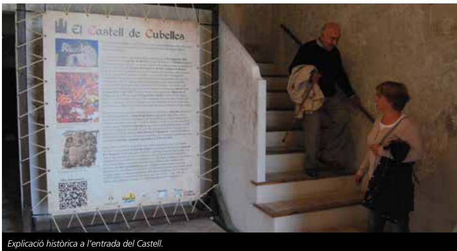
Explicació històrica a l'entrada del Castell.