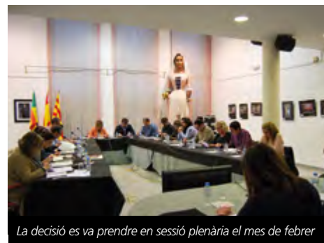
La decisió es va prendre en sessió plenària el mes de febrer

200.000 euros" , tot recordant que la taxa que paguen actualment els veïns "cobreix el 80% de la gestió" . Això no obstant, conclouïa recordant que l'Agència Catalana de Residus augmenta anualment el cànon que cobra als municipis, "xifra que es pot reduir si cada vegada reciclem més i millor" .