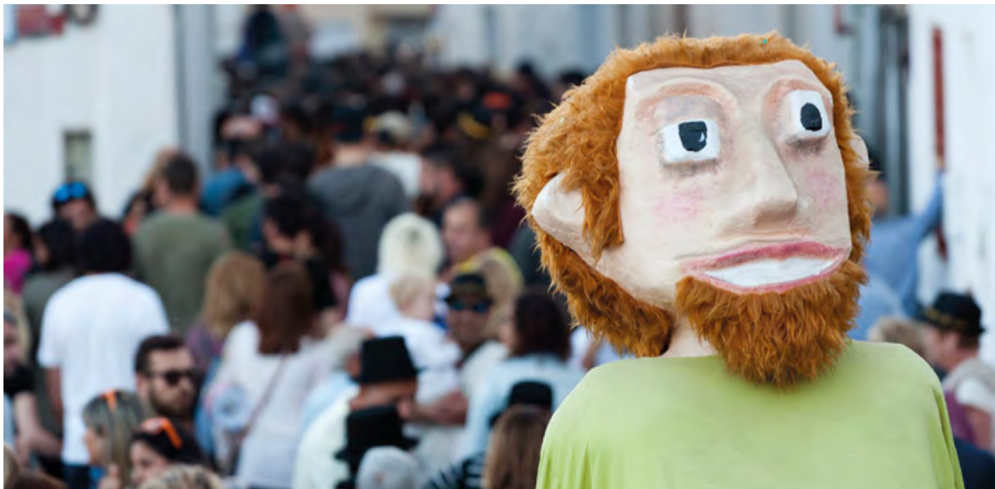
El gegant de l'entitat és dels més estimats pels menuts de la vila.

La història mostra la manca de prejudicis dels infants davant d'allò que els és desconegut