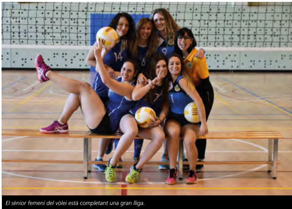
El sènior femení del vòlei està completant una gran lliga.

Els sèniors del club de vòlei es consoliden a la part alta de la classificació