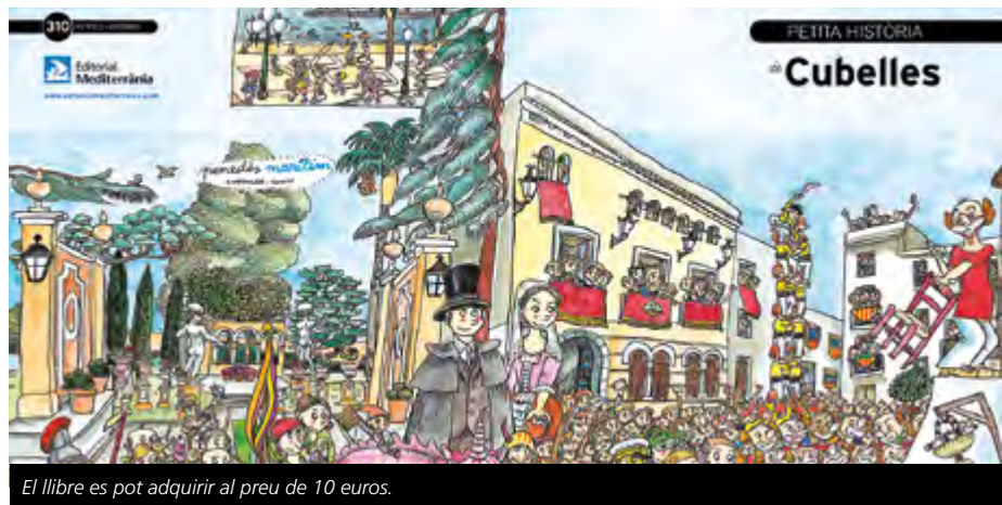
El llibre es pot adquirir al preu de 10 euros.

El seu preu és de 5 euros, malgrat que, si s'adquireixen els dos a la vegada, el preu final serà de 10 euros.