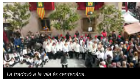
La tradició a la vila és centenària.

d'inactivitat del Cor l'Espiga, l'any 1985 es van recuperar les caramelles infantils i un any després les de la Coral. Des de llavors, cada Diumenge de Pasqua els i les cantaires de la centenària coral no falten a la tradicional cita.