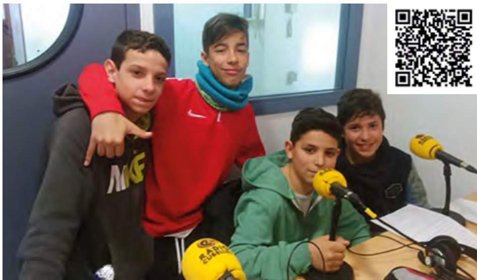
L'alumnat va gaudir d'una intensa jornada a l'emissora municipal.

Tota aquesta feina per anar a Ràdio Cubelles i enregistrar el programa. El matí que vam anar estàvem nerviosos per parlar davant un micròfon però confiats