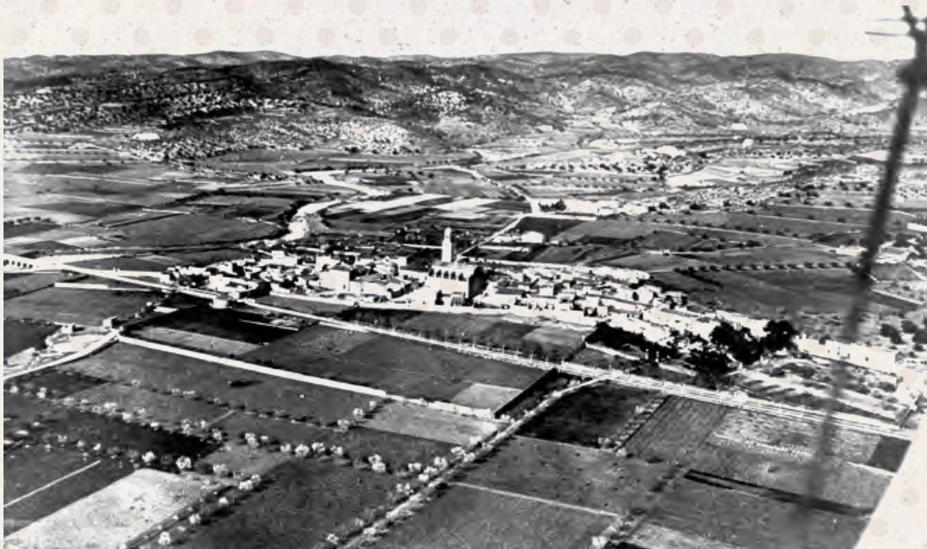
Riera del Foix, dècada de 1920

L'evolució urbanística de Cubelles no és cap secret per a qualsevol que conegui mínimament la vila. Tanmateix, sempre sorprèn veure tot l'entorn del nucli antic envoltat de camps de conreu i terrenys per asfaltar. Malgrat disposar d'un terme força gran, la construcció no es va apoderar del municipi fins ben entrat el segle XX. La imatge correspon a una fotografia aèria presa des d'una avioneta entre 1923 i 1925. Més de noranta anys d'història contemplats a vista d'ocell.