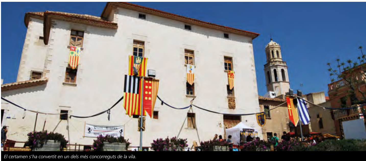
El certamen s'ha convertit en un dels més concorreguts de la vila.

Els dies 30 i 31 de març i 1 d'abril els visitants podran descobrir totes les novetats de la 7a edició