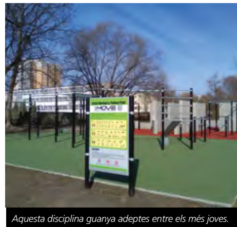
Aquesta disciplina guanya adeptes entre els més joves.

El parkour és una disciplina que consisteix en superar obstacles ràpidament amb salts i grimpades. Va arrencar amb força a partir de l'any 2005 i es va donar a conèixer mundialment gràcies als vídeos de YouTube dels seus aficionats. Amb l'esclat de les xarxes socials, la seva popularitat ha anat augmentant amb els anys, duent a molt ajuntaments a construir espais per practicar-lo, com ara reclamen per Cubelles aquest grup de joves practicants.