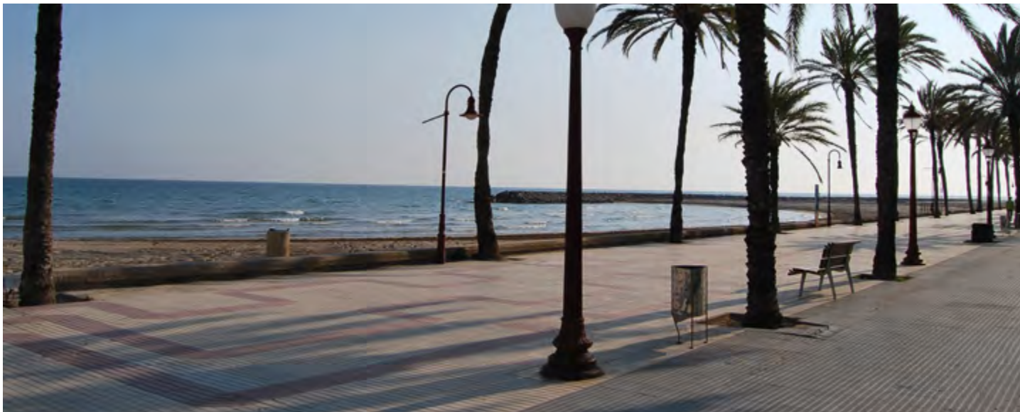
Els comptes inclouen la remodelació del passeig Marítim.