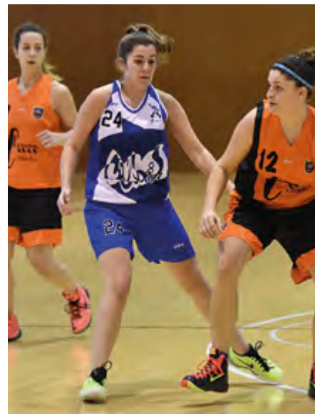
El bàsquet lluitarà per mantenir la categoria.

I pel que fa a el Club Patí Cubelles tot i que la temporada dels dos sèniors és força discreta cal destacar que el femení va superar la primera ronda de copa eliminant un equip de la primera catalana. El masculí en el seu retorn a la segona catalana ha dibuixat una línia de més a menys, situant-se en les darreres posicions a la taula.